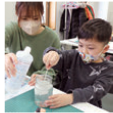
工作教室（定期開催）