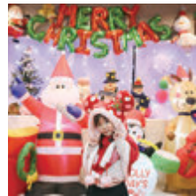
クリスマスイベント