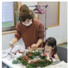
クリスマスリース作り教室